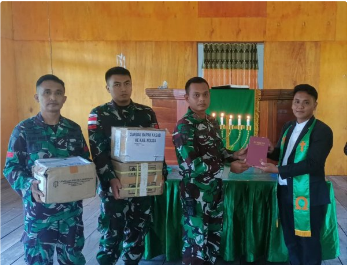
Foto: Satgas Yonif 503/Mayangkara kembali menunjukkan dedikasinya kepada masyarakat di Papua dengan memberikan dukungan alat musik untuk kegiatan ibadah di Gereja GKI Bethesda Batas Batu, Distrik Krepkuri, Kabupaten Nduga. Pada Minggu, 12 Januari 2025.